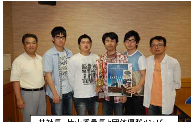
林社長、片山委員長と団体優勝メンバー