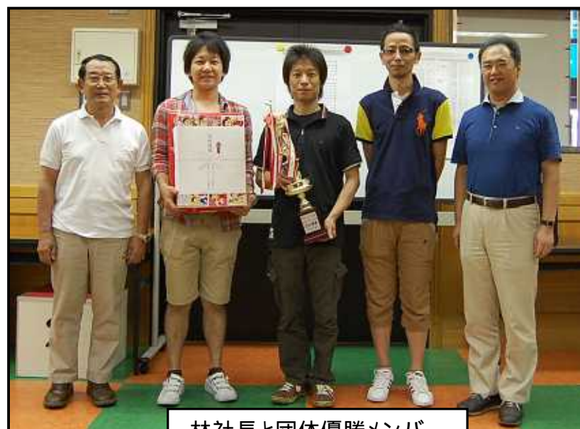
林社長と団体優勝メンバー